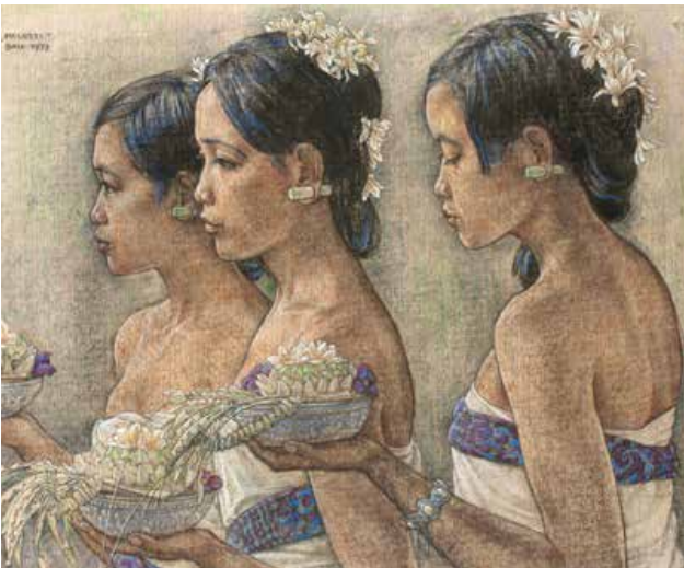
Rudolf Bonnet (1895-1978), Melasti, crayon en pastel op papier, 72 x 96 cm, Bali 1977

Uiteraard waren er ook passanten: kunstenaars die voor een korte tijd Indië bezochten. Een van hen was Isaac Israëls (1865-1934). Voordat hij de reis naar de Oost aanvaarde, had hij al in Den Haag Javaanse dansers en gamelanorkesten gezien. In 1898 tijdens de grote Tentoonstelling van Vrouwenarbeid en in 1916 in de Koninklijke Schouwburg. Naar aanleiding hiervan maakte hij ook schilderijen. In 1921 vertrekt hij echter ook echt naar Indië en maakt er diverse meesterwerken.