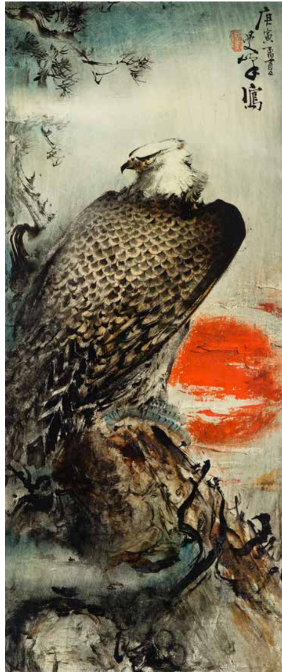
Lee Man Fong (1913-1988), Ontwakende arend, 1950, olieverf op board, 95 x 40 cm