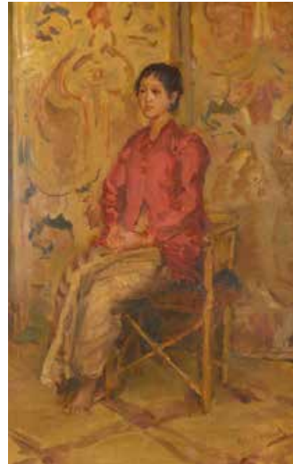
Isaac Israëls (1865-1934), Javaanse vrouw, ca. 1915, olieverf op doek, 80 x 52 cm

Uiteraard zijn er ook in dit genre grote verschillen. De trend is dat de 'top van de top' het beter doet dan ooit, maar dat het overige minder gemakkelijk gaat dan jaren geleden. Een gemiddeld Mooi Indië schilderij is vaak al te koop voor rond 500 euro. Het meest gevraagd zijn uiteraard