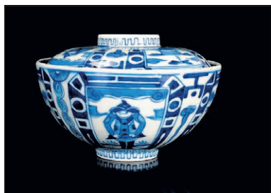
■ Voorbeeld van 'VOC-porselein': 17e eeuwse schaal met de afbeelding van een Hollandse handelaar.